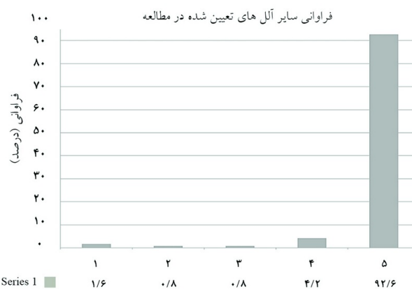
نمودار ۱: فراوانی سایر آلل‌های تعیین شده در مطالعه

سپاسگزاری: این مقاله حاصل پایان‌نامه و طرح تحقیقاتی تحت عنوان "بررسی فراوانی آلل HLA-B*57:01 در بیماران HIV مثبت مراجعه‌کننده به مرکز مشاوره بیماری‌های رفتاری بیمارستان امام خمینی در سال ۱۳۹۱" در مقطع دکترای تخصصی بیماری‌های عفونی و گرمسیری در سال ۱۳۹۲ و کد پایان‌نامه ۲۰۵ و کد طرح ۹۱-۰۱-۵۵-۱۷۳۴۹ می‌باشد که با حمایت مرکز تحقیقات ایدز ایران، مرکز مشاوره بیماری‌های رفتاری بیمارستان امام خمینی و گروه بیماری‌های عفونی و گرمسیری دانشگاه علوم پزشکی و خدمات بهداشتی درمانی تهران اجرا شده است.