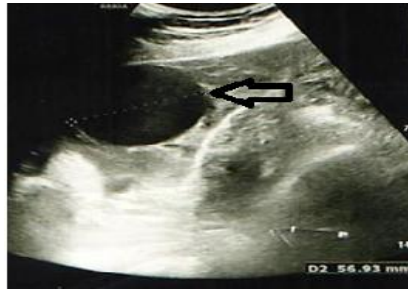
تصویر ۱. سونوگرافی ترانس واژینال. کیست تخمدان راست (فلش سفید)

زنده در رحم و ساک دیگر با جنین دارای قلب و سن بارداری ۷ هفته و ۶ روز در آدنکس راست و دو کیست ۳۷ و ۵۶ میلیمتری با جدار صاف در آدنکس راست به همراه مایع آزاد در شکم و لگن تا زیر هر دو دیافراگم گزارش گردید (تصاویر ۱ و ۲).