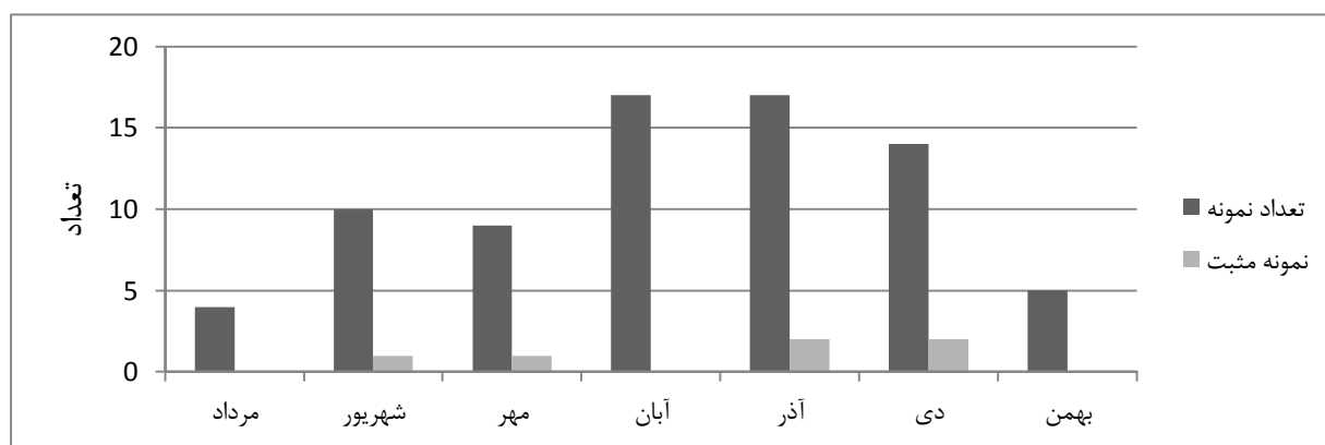
نمودار ۲. توزیع فراوانی و تعداد نمونه‌های مثبت در ماه‌های مختلف