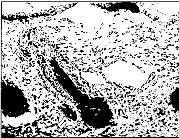
تصویر ۴- عکس میکروسکوپی از پوست ناحیه شانه در ماه چهارم. فولیکول های مو در این مرحله تمایز بیشتری نشان می دهند و لایه های مختلف ریشه مو و غلاف فولیکول مو قابل تشخیص می باشند. علاوه بر غدد چربی (Δ) جوانه هایی از غدد عرق (→) نیز در کنار فولیکول های مو مشاهده می شوند. در این مرحله درم به دو لایه پاپیلری و رتیکلری به ترتیب از جنس بافت همبند سست و رشته ای تمایز یافته اند. اپیدرم در جاتی از شاخی شدن را نشان می دهد. (رنگ آمیزی H&E، بزرگنمایی ۱۶۰×)