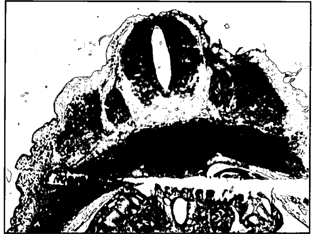
تصویر ۱- عکس میکروسکوپی از مقطع عرضی بخش پشتی در ماه دوم از دوره رشد جنینی. مقطع عرضی لوله عصبی و ستیغهای عصبی در قسمت‌های جانبی آن مشاهده می گردد. سومیت ها در کنار ستیغهای عصبی در حال تمایز بوده و در این مرحله اپیدرم که از اکتودرم حاصل می شود بسیار نازک می باشد. بافت مزانشیمی زیر اپیدرم از سومیت ها بوجود می آید. (رنگ آمیزی H&E، بزرگنمایی ۴۰×)