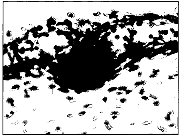
تصویر ۳- مقطع میکروسکوپی از پوست ناحیه صورت جنین در نیمه دوم ماه سوم. اپیدرم دارای ضخامت بیشتری بوده، سلولهای طبقه میانی به حالت متسع در حالی که سلولهای سطحی سنگفرشی می باشند. در این مرحله تکثیر سلولهای اپیدرمی در نواحی خاصی موجب پیدایش فولیکول های مو به طور اولیه گردیده که به طرف بافت زیرین برآمده گشته است. این روند رشد با لایه نازک و متراکمی از سلولهای مزانشیمی زیرین همراه می گردد. (رنگ آمیزی H&E، بزرگنمایی ۴۰×)

تیره در سیتوپلاسم آنها وجود دارد، که احتمالاً این سلولها ملانوسیت یا ملانوفور می باشند. به نظر می رسد که در این مرحله ملانوسیت ها در اپیدرم تمایز یافته اند و اغلب در قاعده سلولهای طبقه بازال و یا در بین آنها بادانه های قهوه ای مشخص می شوند. در مراحل پایانی این دوره فولیکول های مو به صورت توده های متراکم سلولی در داخل اپیدرم به طرف درم برجسته شده و در فواصلی از یکدیگر مشاهده می شوند که قبل از این چنین نواحی به صورت افزایش ضخامت اپیدرم مشخص می شود. در محل پیدایش جوانه های فولیکول مو سلولهای اپی تلیالی به صورت توده توپر به داخل کشیده شده و سلولهای مزانشیمی زیر اپیدرم که یک لایه سلولی متراکم و نازکی را در این ناحیه تشکیل می دهند و به صورت متراکم تر در پیرامون فولیکول های مو قرار دارند (تصویر ۴). میزان پیشرفت فولیکول های مو در ناحیه صورت از