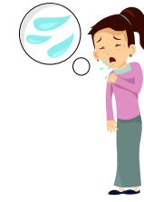
سائر سوائل الجسم