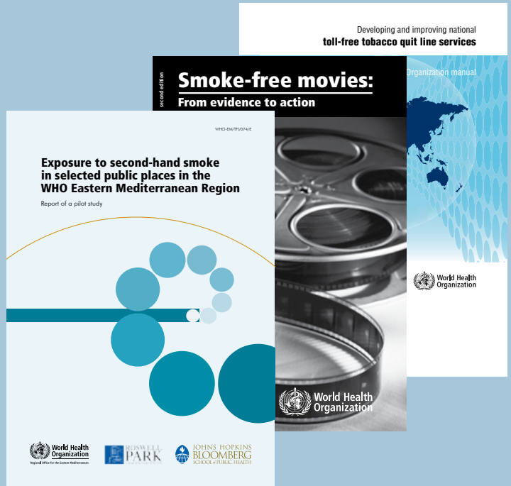
↑ آخر المطبوعات حول مكافحة التبغ

الزيادة المفزعة في حجم الأمراض غير السارية، وفي ترجمة هذا الالتزام إلى عمل ملموس يتجسد في تنفيذ إطار العمل الذي تم إقراره في الدورة التاسعة والخمسين للجنة الإقليمية.